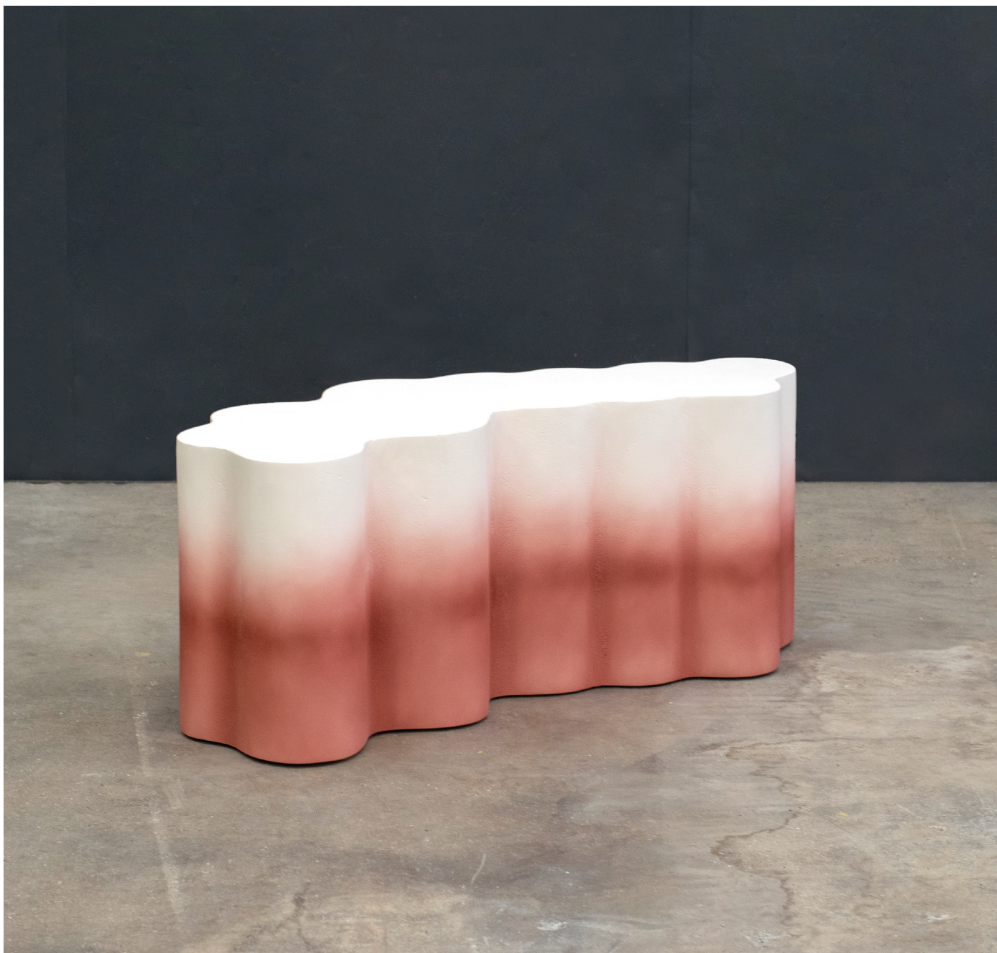
Table Basse Lithos