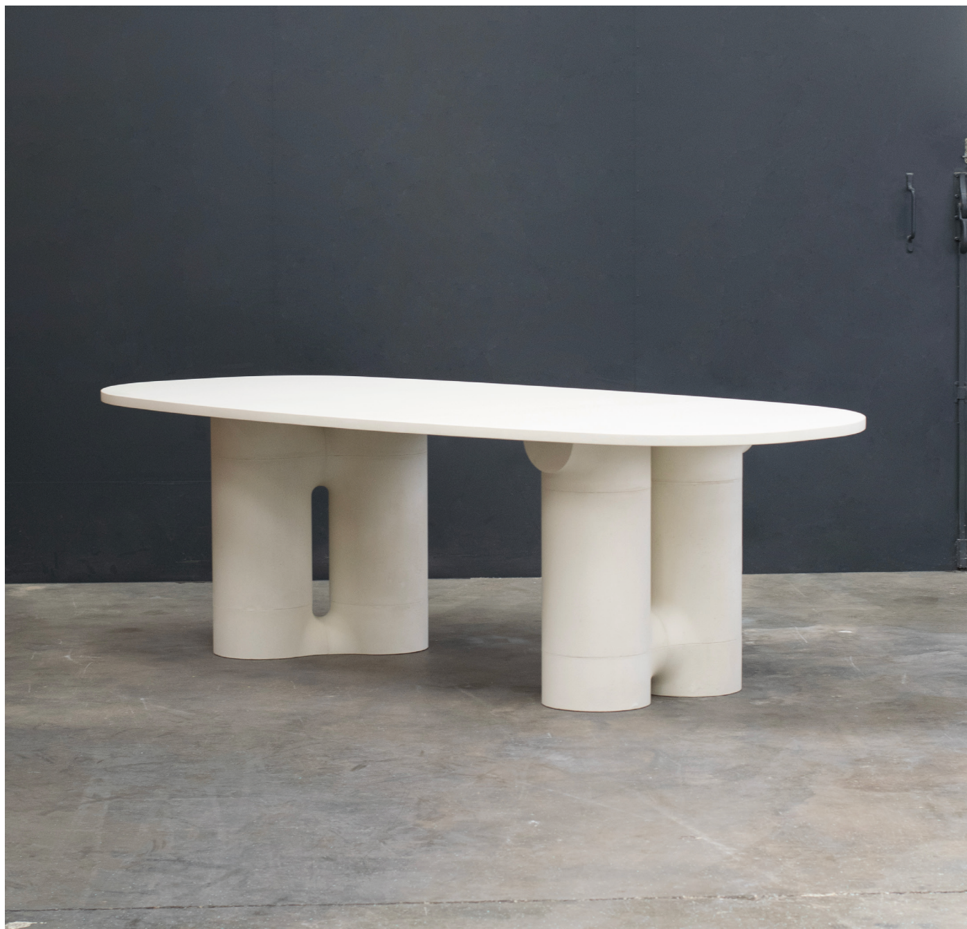
Table ovale 2 pieds